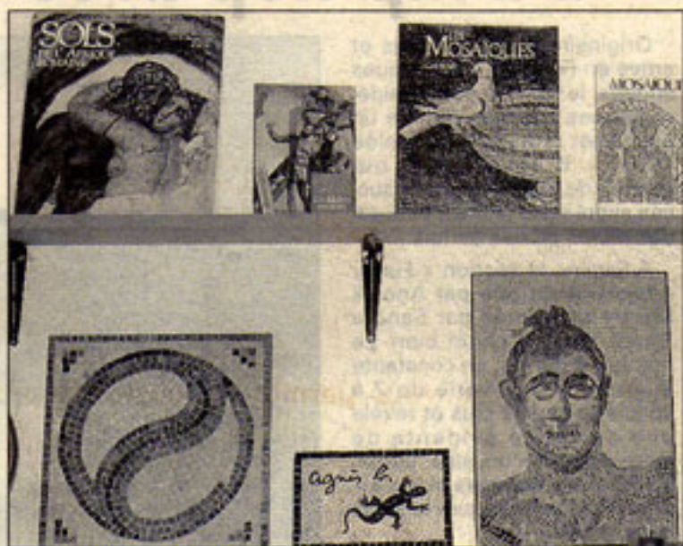
Marbre, carreau cassé, pâte de verre ou coquillages, les matériaux sont très nombreux.